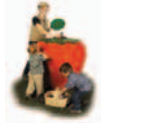
Spezialist für Komposter

remaplan GmbH Marxhofstraße 1 D-82008 Unterhaching Telefon 089/61 52 19-0 Telefax 089/61 52 19-19 E-Mail info@remaplan.de Internet www.remaplan.de